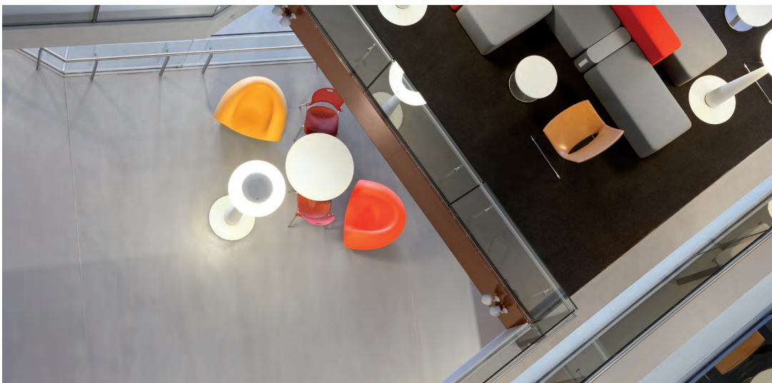
Objekt: Fakultät für Ingenieurwissenschaften und Informationstechnik - UTS Sydney

PANDOMO® Floor also achieves maximum durability with minimal effort. Even at a thickness of 5 millimetres it is permanently resilient like high-quality parquet or soft natural stone. PANDOMO® Floor surfaces are suitable for underfloor heating and chair castors and are resistant to colour fading. The basis for PANDOMO® Floor is the designer levelling compound PANDOMO® K1. Treating the floor with the specially formulated PANDOMO® impregnating and sealing products ensures that it preserves its unique look whilst being perfectly protected against dirt and other external factors.