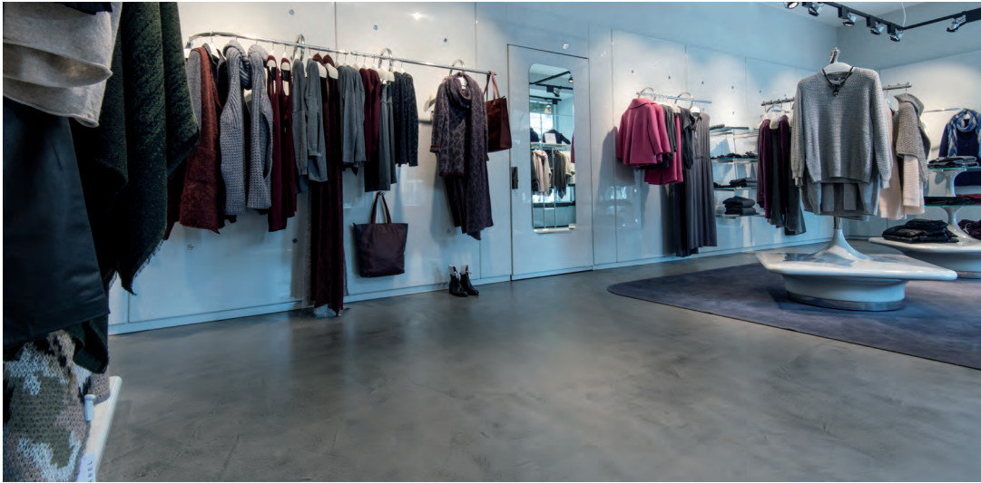
Objekt: Stefanel, Potsdam