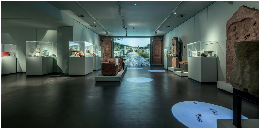
Objekt: „Raum Gräberfeld“ Kurpfälzisches Museum der Stadt Heidelberg Heidelberg

Choosing the right flooring is a hot topic in commercial areas which often see heavy traffic. A tough consistency and strong material is a prerequisite. PANDOMO® Loft not only withstands permanent strain, but also makes each room special, with its unique characteristics.